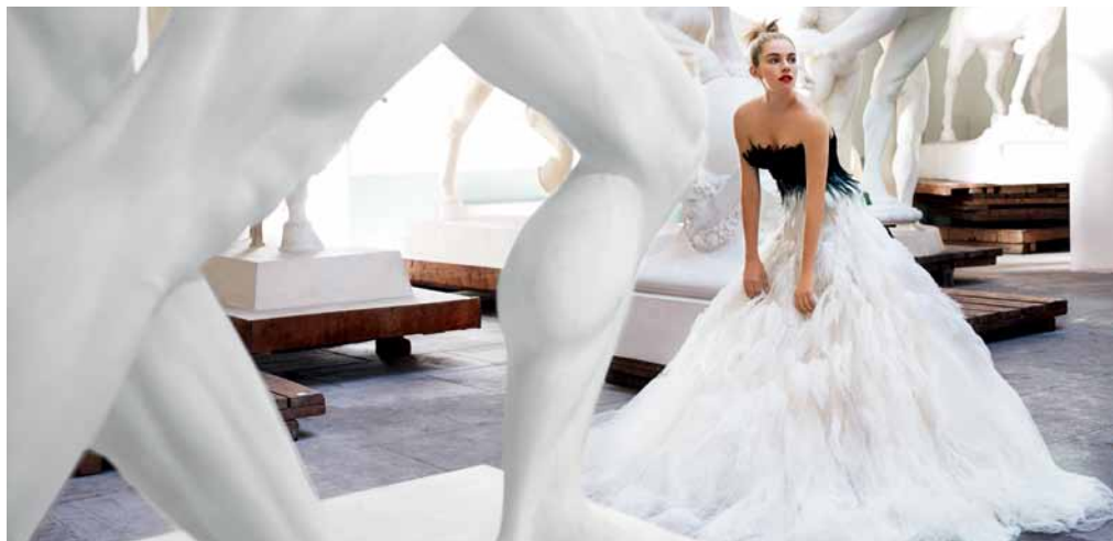
Sienna Miller, Roma, 2007, American Vogue. © Mario Testino

Malba presenta la primera exposición en la Argentina de Mario Testino, uno de los fotógrafos de moda más influyentes del mundo. Se exhibe un conjunto de 122 fotografías, seleccionadas por el propio artista, que brinda un panorama completo de su obra y pone de relieve sus provocativos contrastes.