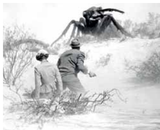
El mundo en peligro, de Gordon Douglas

Son muchos. Vienen del espacio. Pero también pueden ser comunistas. O simplemente "otros" que no somos nosotros. A veces tienen forma humana, otras son animales, bestias enfurecidas que matan y devoran todo. Y a veces son invisibles, porque es más barato. La cuestión es que vienen, que ya están llegando y que durante todo marzo desembarcarán en las trashnoches de malba.cine. Se verán films de, entre otros, Philip Kaufman, Hugo Santiago, Joseph Zito, Gordon Douglas, Ishiro Honda, Merian C. Cooper y Ernest B. Schoedsack.