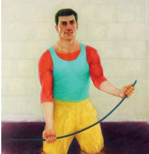
Ricardo Garabito. Hombre con pantalón amarillo , 1996.

En marzo, Malba presenta la exposición Garabito. La donación , un conjunto de 31 obras del artista argentino Ricardo Garabito, realizadas entre 1965 y 2007, y donadas por el artista al acervo del museo. Este generoso gesto representa una enorme contribución a la tarea de promoción y divulgación del arte argentino y latinoamericano: es la primera vez que un artista de gran trayectoria decide donar en vida a Malba un conjunto de sus obras más representativas.