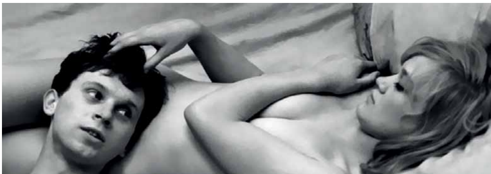
Los amores de una rubia, de Milos Forman.

LOS LOCOS DE LA MANIVELA (1979) de Jirí Menzel. 90'.