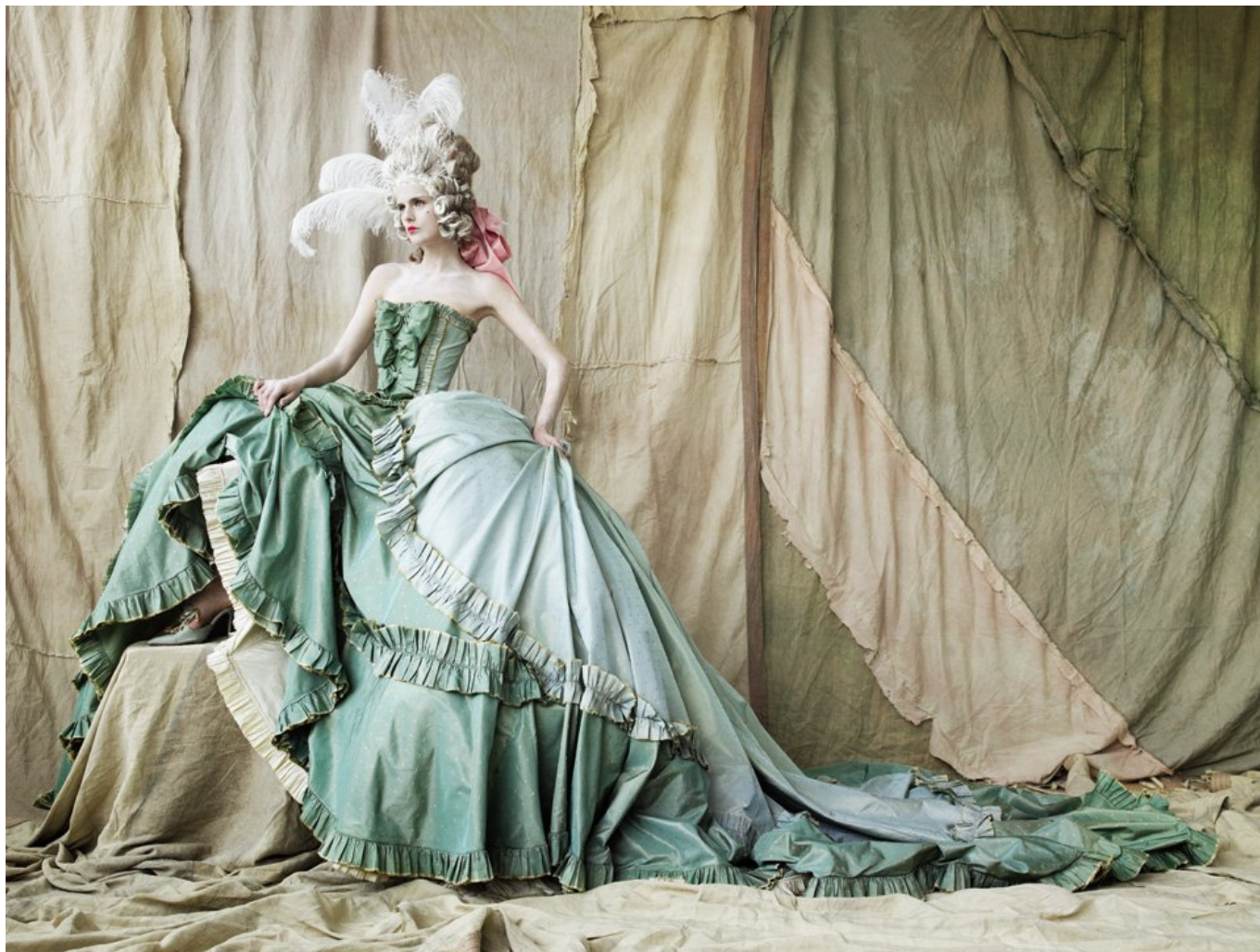
STELLA TENNANT, NEW YORK, 2006, AMERICAN VOGUE